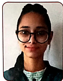
Samriti 83.6% (Hum.)