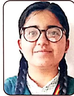
Manvi 85.6% (Hum.)