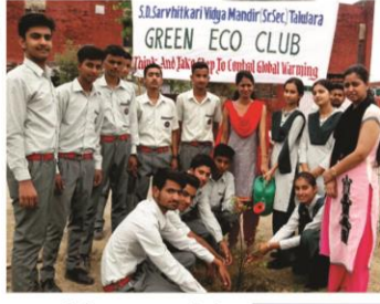
5 जून - विश्व पर्यावरण दिवस पर पौधारोपण करते ईको क्लब के विद्यार्थी व अध्यापक