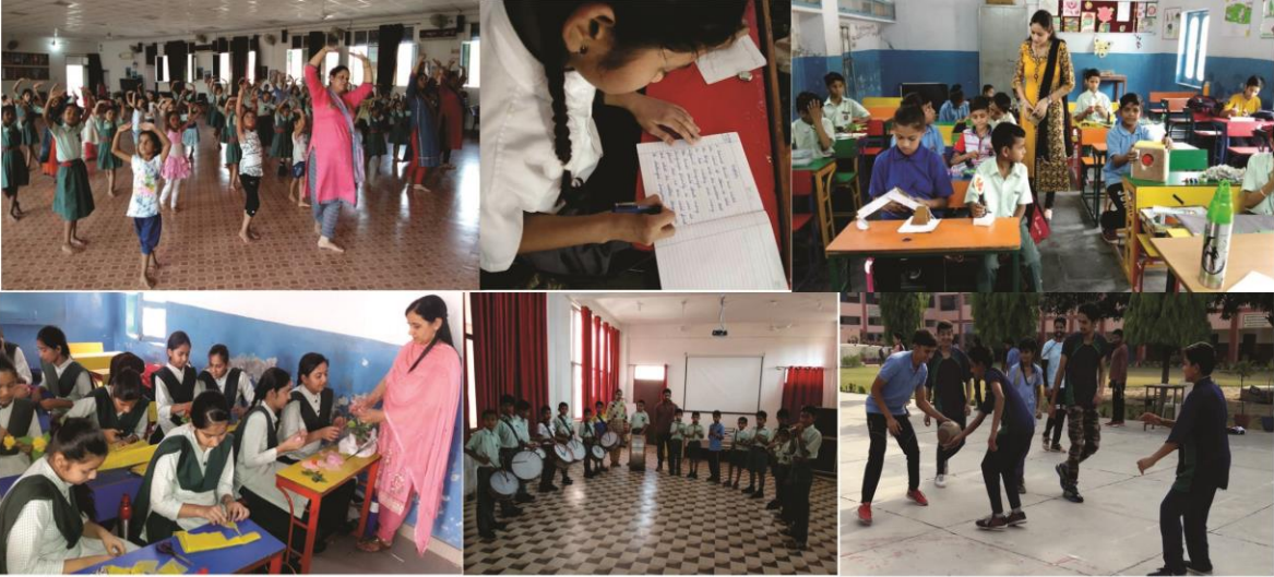
28 मई से 2 जून - अवकाश में विकास की दृष्टि से विद्यालय में विभिन्न कैम्पों का आयोजन किया गया। जिसमें विद्यार्थियों ने संगीत, वाद्ययंत्र, वैदिक गणित, नृत्य, सुलेख, खेलों के भिन्न भिन्न आयाम, घोष वाद्य यन्त्र, बालिका व्यक्तित्व विकास आदि अनेकों गतिविधियों के माध्यम से अपनी कौशलताओं को बढ़ाया।