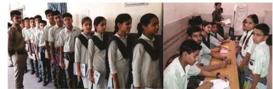
19 मई 2018 - विद्यार्थियों को भारतीय लोकतान्त्रिक चुनाव प्रणाली से अवगत करवाने हेतु चुनाव प्रक्रिया दौरान मतदान करते हुए विद्यार्थी मतदाता