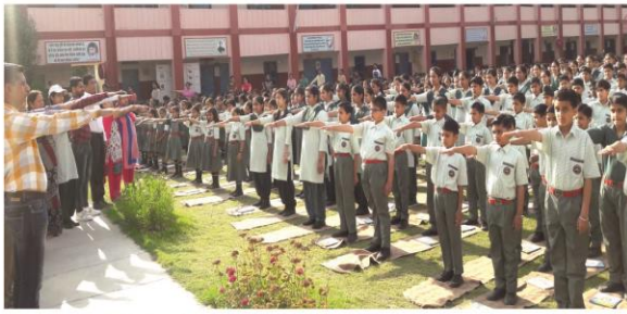
7th April, 2018 - Students and teachers took pledge to avoid Junk food and follow healthy diet on World Health Day.