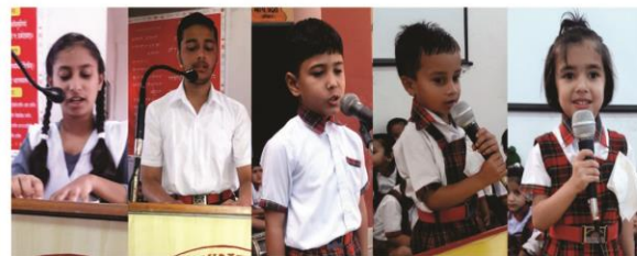
English Poem recitation competition was held on Rabinder Nath Tagore's birthday 5th May 2018. More than 70 students took part from different departments with great zeal and enthusiasm. The motive of this competition was to build confidence among the students to write verses themselves.