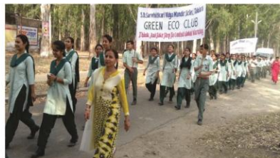
1 जून 2018 - स्वच्छ भारत अभियान के तहत स्वच्छता रैली निकाल कर लोगों को स्वच्छता का सन्देश देते विद्यार्थी।