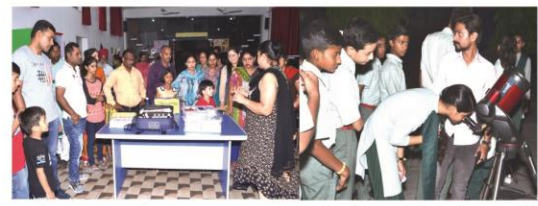
22 मई 2018 - साईस क्लब द्वारा आयोजित नाईट स्काई वाचिंग कार्यक्रम दौरान टिकरिंग लैब का अवलोकन करते अभिभावक तथा टैलिसकोप के माध्यम से आकाश में तारामण्डल देखते हुए विद्यार्थी।