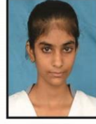
TANIYA Phy. Edu. 98%