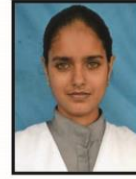
Rajju English 93% Phy. Edu. 98%